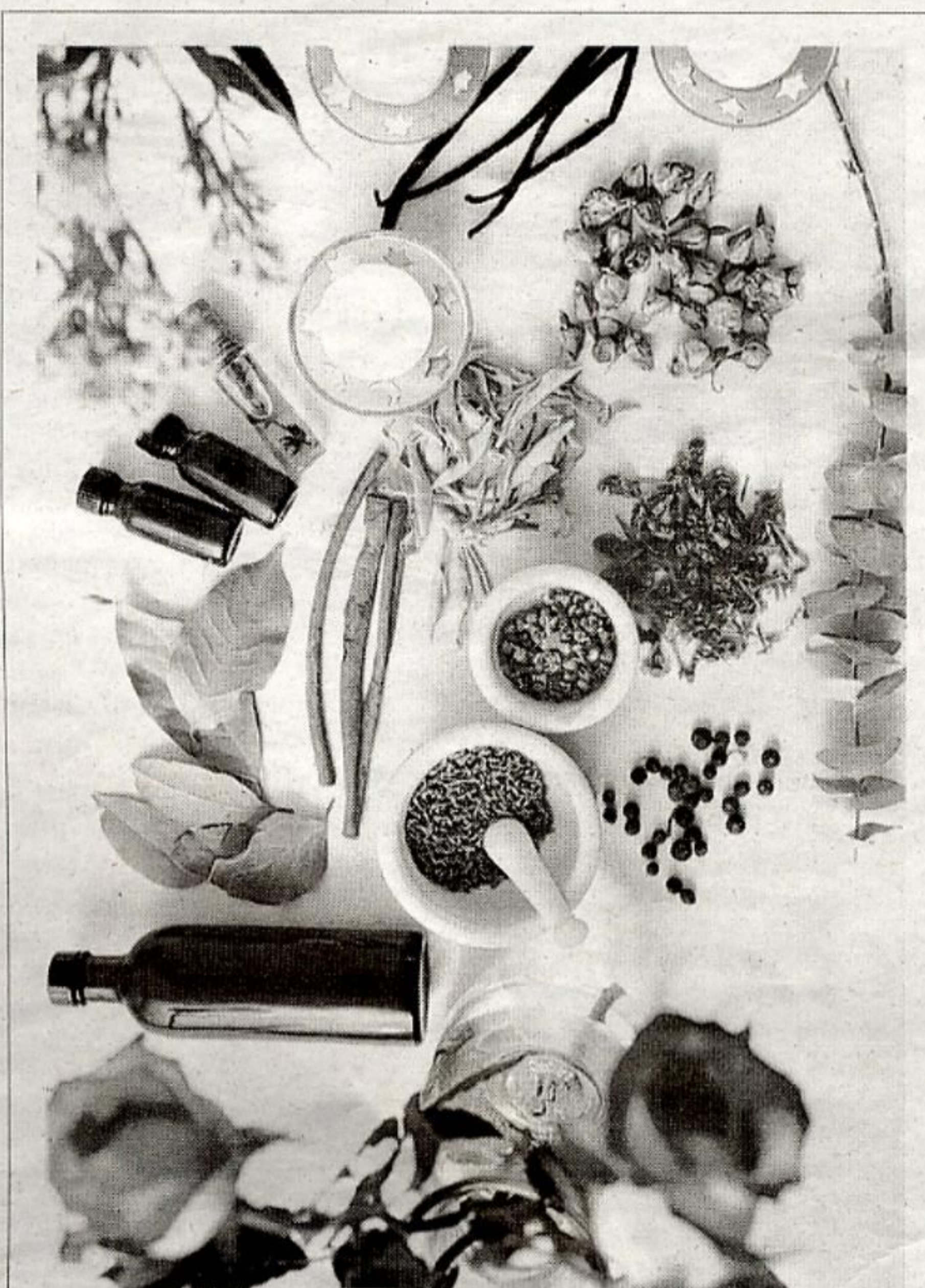
Naturaleza y tecnología, de la mano en los centros de belleza

Junto a los nuevos aparatos y las microinyecciones o cremas avanzadas, los viejos masajes —puestos al día— o las danzas orientales aseguran el bienestar